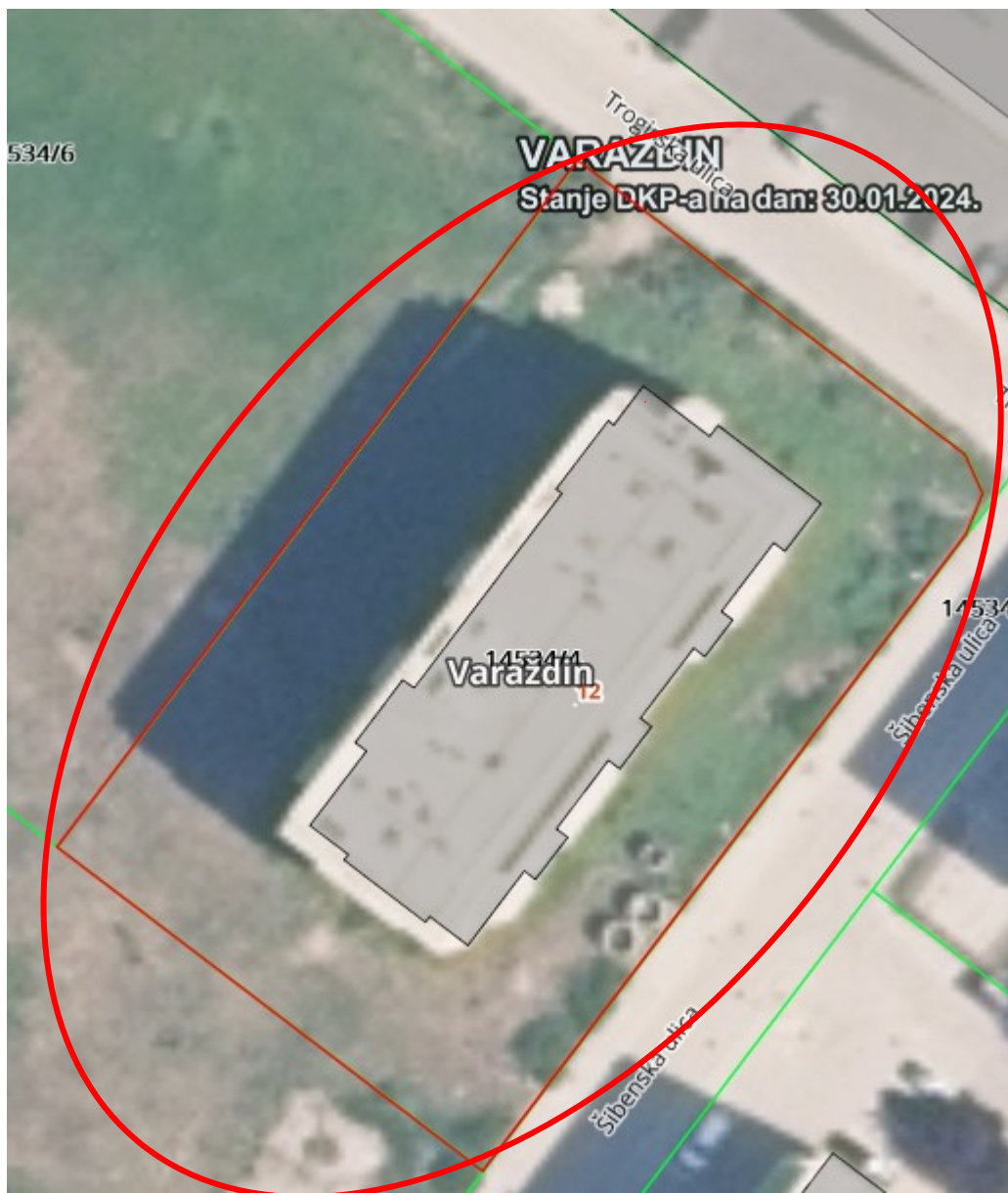
Slika: Ortofoto snimak područja nekretnina

Lokacija: Predmetna nekretnina nalaze se u Varaždinskoj županiji, u katastarskoj općini Varaždin. Katastarska čestica k.č.br. 14534/4 k.o. Varaždin